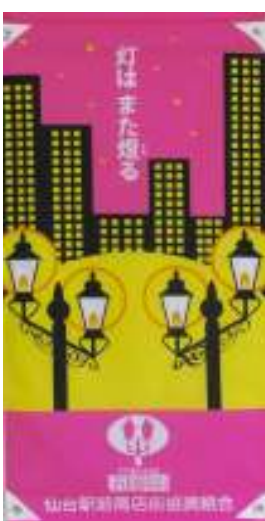
第十六回 柳 匡成 (学生)