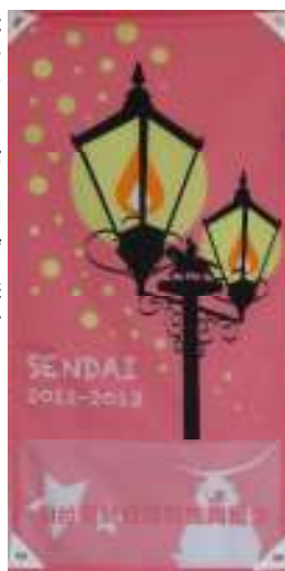
第十七回 関谷 来来 (高校生)