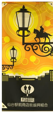
第二一回 月岡 奈々 (学生) 平成28年