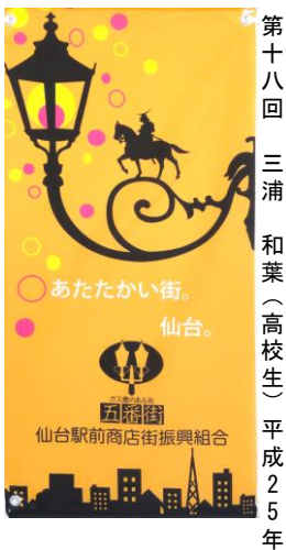
第十八回 三浦 和葉 (高校生) 平成25年